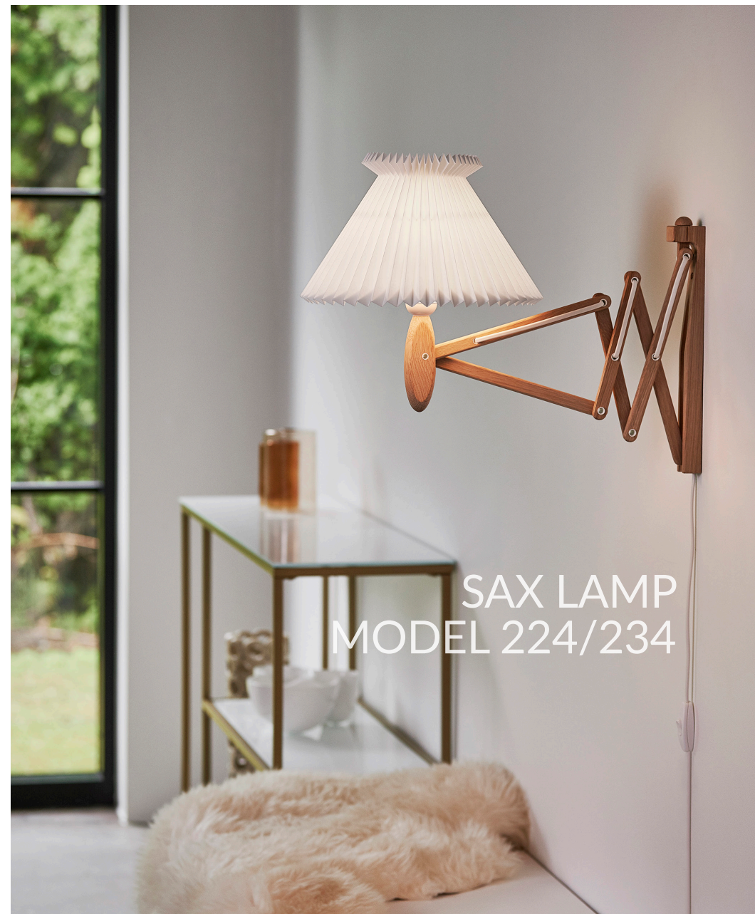
SAX LAMP MODEL 224/234

Das ganz Besondere an der Saxl Lampe ist, dass sie wie eine Ziehharmonika herausgezogen und hineingeschoben werden kann, je nachdem, wo Sie das Licht brauchen. Darüber hinaus ist die Sax-Lampe sowohl in einer nach oben als auch nach unten gerichteten Version sowie in verschiedenen Holzarten und Kombinationen erhältlich.